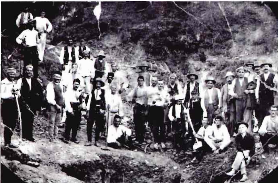
Радови на изградњи зграде хидроелектране...

Факсимил преписке "Лесковачког електричног друштва" и лесковачких текстилних фабрика са фирмом "Siemens"