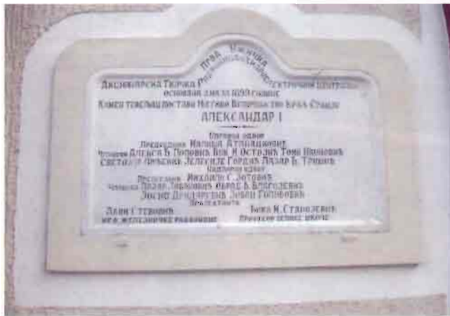
Спомен плоча градитеља и акционара прве хидроцентрале на Ђетињи