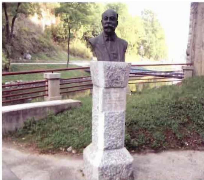
Биста Ђорђа Станојевића у дворишту хидроцентрале