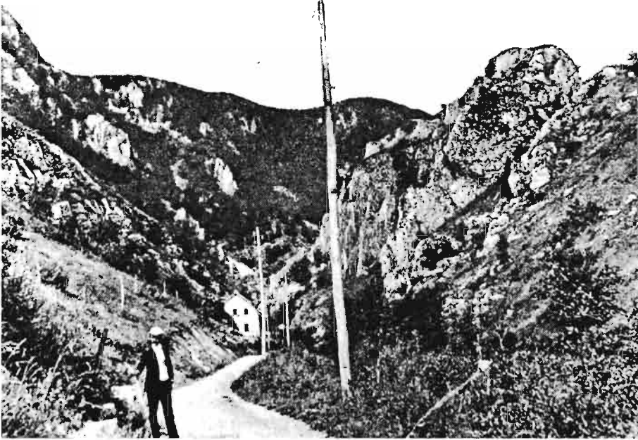
Централа под Градом, прва хидроцентрала у Србији (1900)

дивне реке Ђетиње и њени[х] водени[х] падова употребљавати пару и казан, а да цабе Ђетиња пролази кроз Ужице. Одбацимо то све па усвојимо турбину... Подигните млин под Градом.“