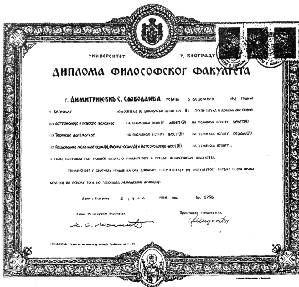
Слика 2. Факсимил прве дипломе из астрономије, издате Слободанки Димитријевић, на Универзитету у Београду.