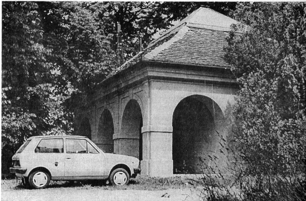
Слика 1. Зграда Опсерваторије на Петроварадинској тврђави.

mm и „14 T“ 60/900 mm, са одговарајућим оптичким прибором потребним за астрономска посматрања. У периоду 1976 – 1986. комплетно је опремљена фотолабораторија, купљена наставна средства (графоскоп, диа пројектор, кино пројектор итд.) а за потребе астрофотографије набављени одговарајући телеобјективи: Zeiss Sonar 180 mm / f: 2,8; Pentacon 300 mm / f: 4; Pentacon 500 mm / f: 5,6; МТО 100 1000 mm / f: 10 итд. Захваљујући сретним околностима 1991. године добијени су рефлекторски телескопи „MEADE“ 200/1500 mm и 102/1000 mm. За припрему и обраду астрономских посматрања од 1989. године користио се рачунар „ATARI 1040 ST“, а од 1994. године РС 486/100 MHz.