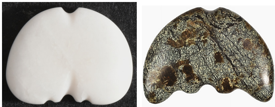
Слика 11: Фигурине породиље са симболом фалуса, представом уретре на темену. 10