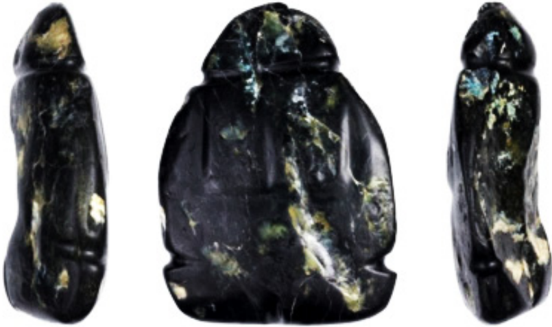
Слика 4: Фигурина Мајка са дететом. Чак и „најженственија“ фигурина, статуета мајке са новорођенчетом на грудима, посматрана са бочних страна, је итифалична.