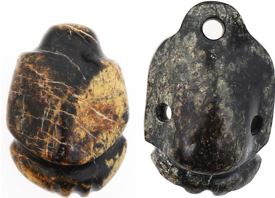
Слика 5: Примерци фигурина породиља чији је доњи део у виду српа Месеца, на коме је представљена вулва непосредно уочи порођаја. 4