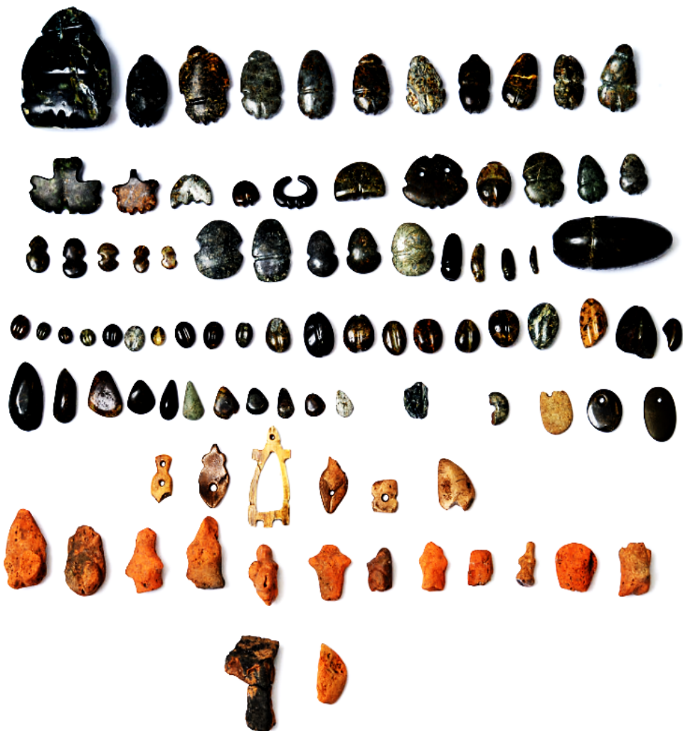
Слика III: Основа култне јаме (објект 1) на западном ободу кружног храма (објект 2) пречника 75 м, окарактерисане изразито црном бојом (због велике количине органске материје) са бројним фигуринама од керамике, камена и кости. Уочава се и оштећење у виду дијагоналне траке светле боје, настало приликом равнања пута механизацијом.