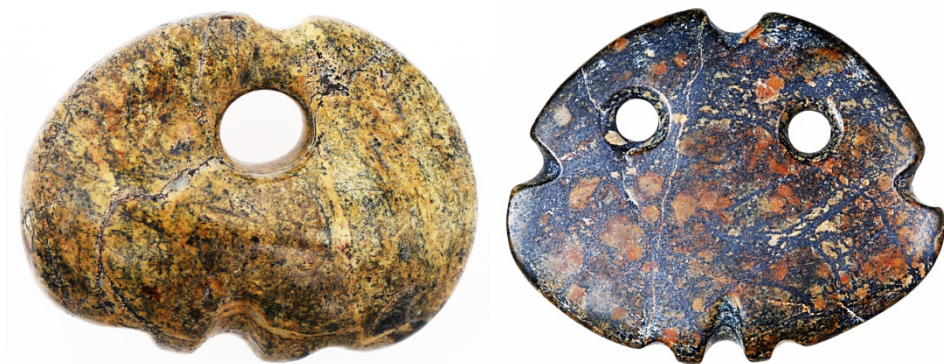
Слика 10: Фигурине породиље у виду Месеца „са грбом“, са представом отвора уретре на темену и једним, односно два отвора 9