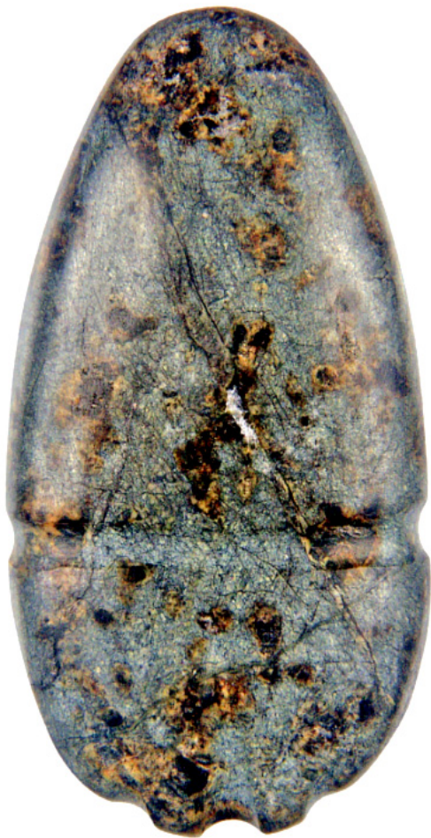
Слика 12: Итифалична фигурина породиље. 11