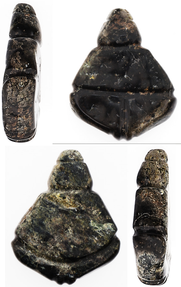
Слика 3: Друга по величини фигурина породиље из Белице. Доњи део, с вентралне стране, је у облику српа Месеца, а са дорсалне стране – полумесеца. 3 Горњи део фигурина је наглашено итифаличан, а иста слика се добија посматрањем са бочних страна.