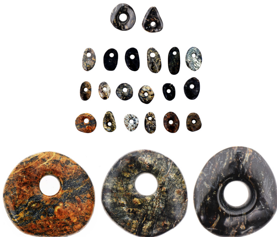
Слика 13: Заједнички налаз перли од серпентинита и неколико перли из тог налаза приближно кружног облика, који, могућно, предочавају сунчеви колут. 12