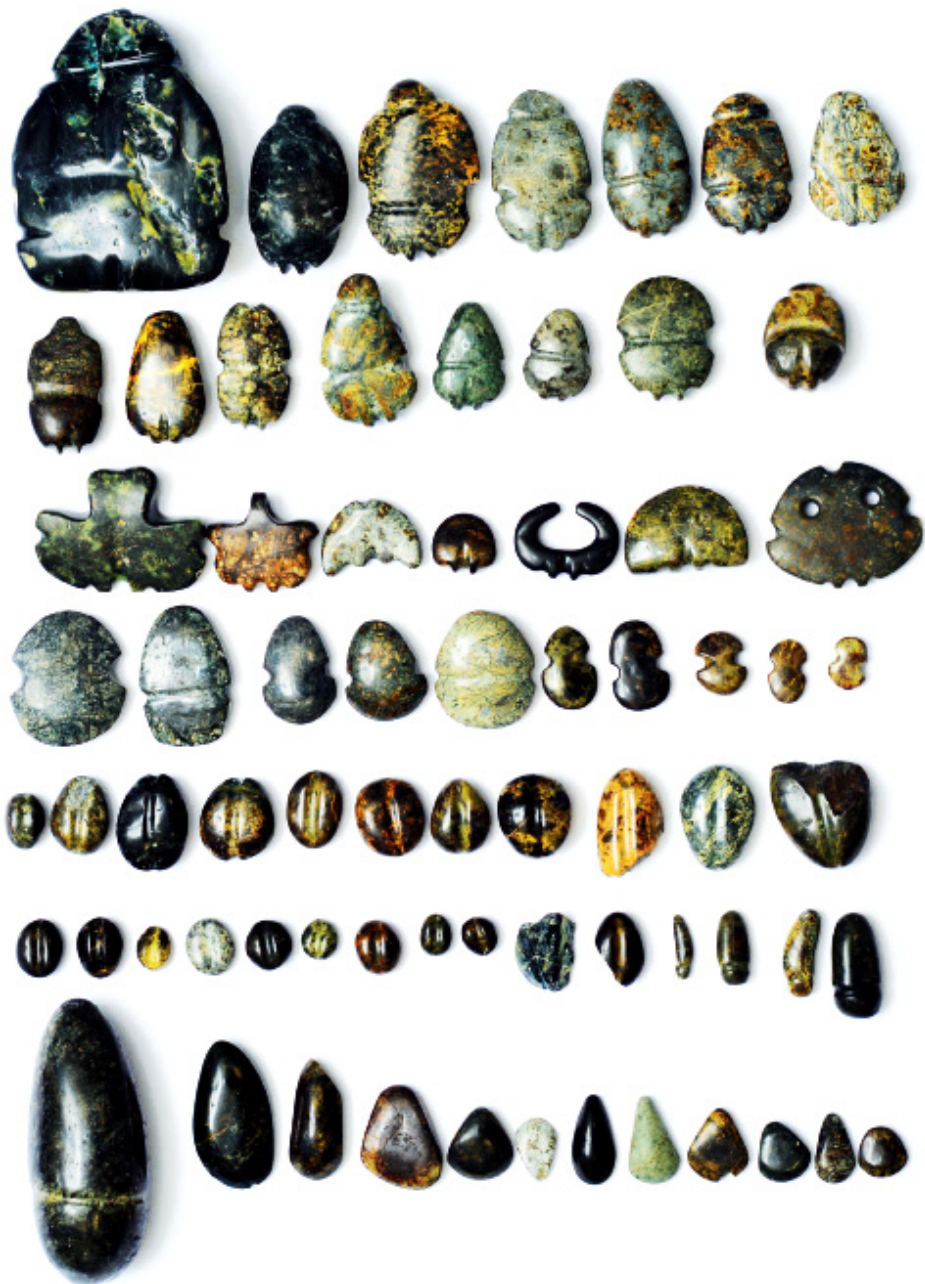
Слика IV: Фигурине од серпентинита из култне јаме на ободу кружног храма. Са култно-астрономског насеља Појате-Појила у Белици потиче 40 шематизованих фигурина породиља од серпентинита, које имају само један натуралистички приказан детаљ – изглед вулве уочи самог порођаја. Све те фигурине, посматрано са бочних страна, имају облик фалуса док је код