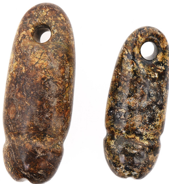
Слика 14: Фигурине фалуса, симбола сунчевог подизања и оплодње. 13