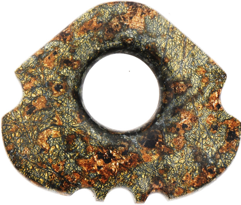
Слика 6: Јединствени примерак фигурине породиље из Белице у чијем средишту се налази велики кружни отвор, који је особен за фигуралне представе повезане са Сунцем. 5 С обзиром на лунуласти изглед доње половине и постојања великог круга у центру, фигурина симболише два, за човека најзначајнија небеска тела, Сунце и Месец.