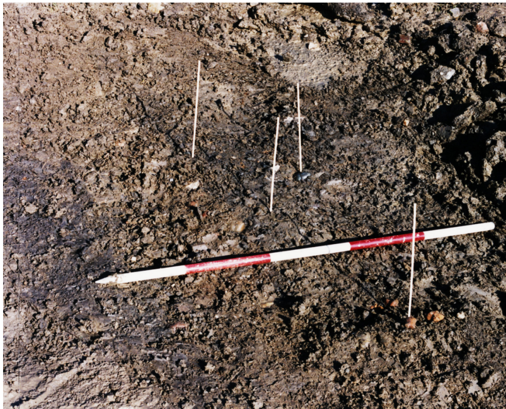
Слика II: Основа култне јаме (објект 1) на западном ободу кружног храма (објект 2) пречника 75 м, окарактерисане изразито црном бојом (због велике количине органске материје) са бројним фигуринама од керамике, камена и кости. Уочава се и оштећење у виду дијагоналне траке светле боје, настало приликом равнања пута механизацијом.

На свим фигуринама породиља удружени су реалистичка представа Месеца, у облику српа Месеца, грбавог Месеца или полумесеца, и алегорија Сунца у виду фалуса са уретром или само уретре. Смисао овог дуализма, прожимање божанског духа – Сунца и материје – Месеца, на култним објектима је недвосмислен – живот зависи од две апсолутне силе, месечеве која ствара услове за живот и његову обнову (плодно земљиште, влага, двадесетосмодневни плоносни циклуси), с једне стране, и сунчево семе и његова светлост и топлота, с друге стране.