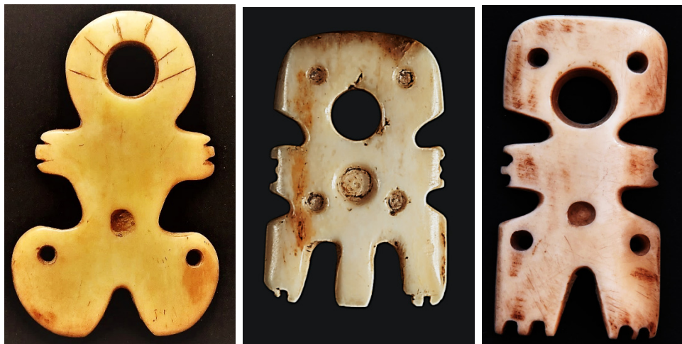
Слика 15: Статуете божанстава Сунца протостарчевачке културе са локалитета Медведњак, на којима се налазе ознаке бројчане вредности 12 (слика лево; шест дужи око круга на глави и по три прста на рукама; слике у средини и десно по три прста на рукама и ногама, укупно по 12). 14