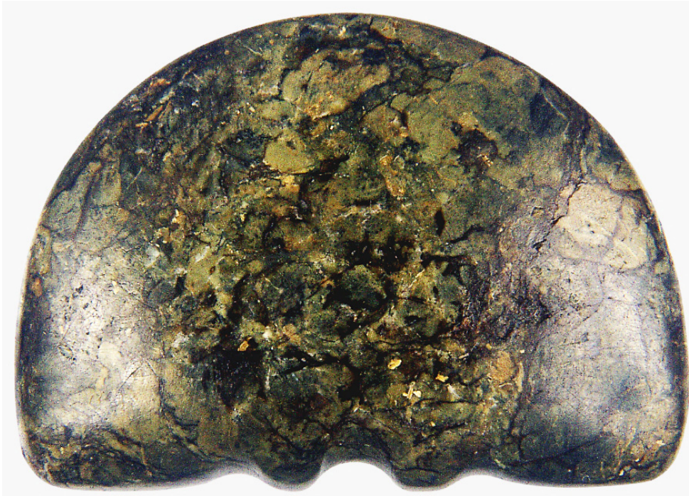
Слика 8: Полумесечаста фигурина породиље. 7