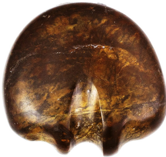
Слика 9: Фигурина породиље у виду Месеца са грбом. 8