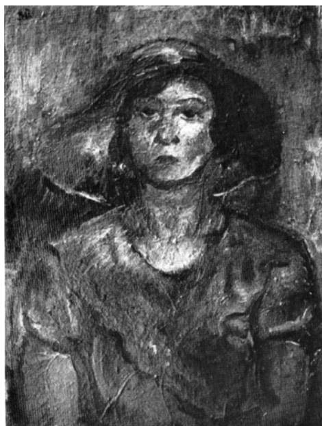
Слика 7: Слика Зоре Петровић "Жена са шеширом", уље на платну. Власништво Музеја савремене уметности у Београду.

Као матурант ишла је на часове сликања код познате сликарке Зоре Петровић (1894-1962) која је и насликала Слободанкин портрет, познат као "Жена са шеширом". Та слика је била изабрана и за ретроспективну изложбу слика Зоре Петровић, одржану од 27. марта до 7. маја 1978, у Музеју савремене уметности (Крстић, 2008). Зора је саветовала да се бави вајарством "јер боље осећа облик од боја".