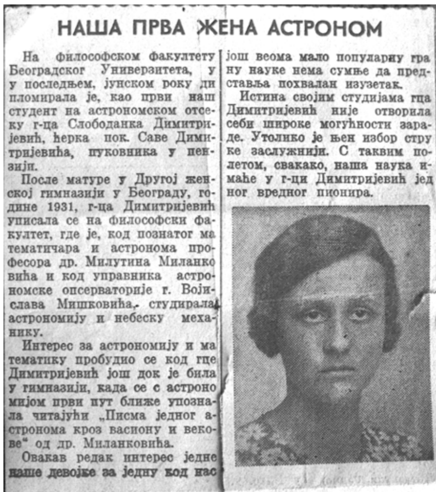
Слика 4: Чланак у листу "Политика" о дипломирању првог астронома на Универзитету у Београду.