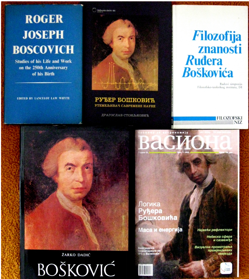
Слика 3: Стоиљковићева монографија симболично уметнута између зборника који је уредио Л.Л. Вајт 1961.г. и зборника који је уредио В.Позаић 1987.г. уз сјајну Дадичеву монографију и насловну страну књиге XIII часописа ВАСИОНА (Бр.1 за 2005.г) Астрономског друштва Руђер Бошковић из Београда, са радом Б.А. Јовановића о логици Р. Бошковића.

Глава 8. Филозофске основе Бошковићевих схватања нису нужан, али свакако представљају веома, веома користан додаток студији, јер филозофски концепт de facto постоји у свакој УСПЕШНОЈ теорији. Поведени понашањем папе у случају Коперниковог (и Аристарховог) открића, научници су крајем 17. века ИСТЕРАЛИ ФИЛОЗОФИЈУ ИЗ ФИЗИКЕ, добивши независност у истраживању, али изгубивши време у