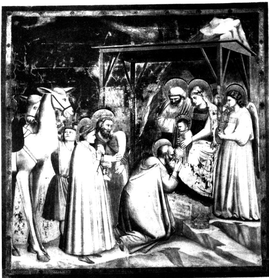
Слика 1: Ђотова (Giotto di Bondone) фреска из 1302. године у капели Скровењи (Scrovegni Chapel), у Падови, у Италији, са кометом у горњем централном делу слике. Фреска приказује долазак три мага која одају почаст новорођеном Христу (Schechner, 1997).