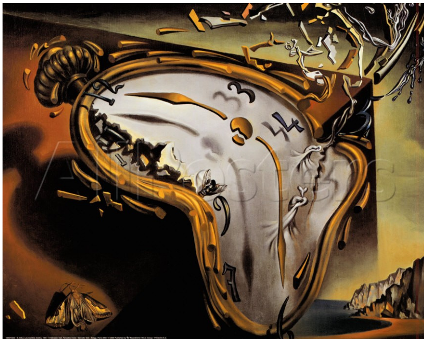
Слика 3: Салвадор Дали: Меки сат у тренутку прве експлозије .

У авангардној уметности, поред алхемијског вида, присутан је и феномен хермафродита (андрогина), на пример, на фотографијама поменутог Марсел Дишама, и то у духу еротског, животног и космичког, што се заснивало на алхемијској игри промена. Онај симбол (андрогина и алхемијског) коришћен је у надреализму, посебно у сликарству Салвадора Далија и Макса Ернста. У постмодернистичком сликарству с краја 80-их и 90-их година, поменути симболи појављују се у слојевитој симболици телесног, уз усмереност ка сликовно-симболичкој и алегоријској размени љубавно-еротских сензација помешаних са еротском и космичком имагинативношћу.