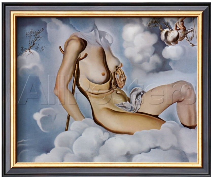
Слика 2: Салвадор Дали: Мед је слађи од крви

засенчења, у својој бити оптимистичко, чак и онда када је драматски болно и трагично. Он је успевао да оживи понекад и посуновраћена осећања, а потом да их својим линијама, небеским колоритом душе и фантазмагоричним сликама уобличи и изрази, препуштајући их могућим асоцијативним доживљајима других.