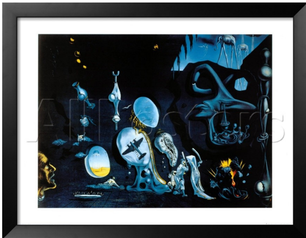
Слика 4: Салвадор Дали: Атомска идила.

Салвадору Далију. И то нарочито када је у питању стваралачки асамблаж и колажирање, уз продуховљено компоновање и обликовање предметних појединости у духу надреалистичке ликовне поетике. При том се догађало сасвим неуобичајено, скоро чудесно зближавање и придруживање онога што је неспојиво.