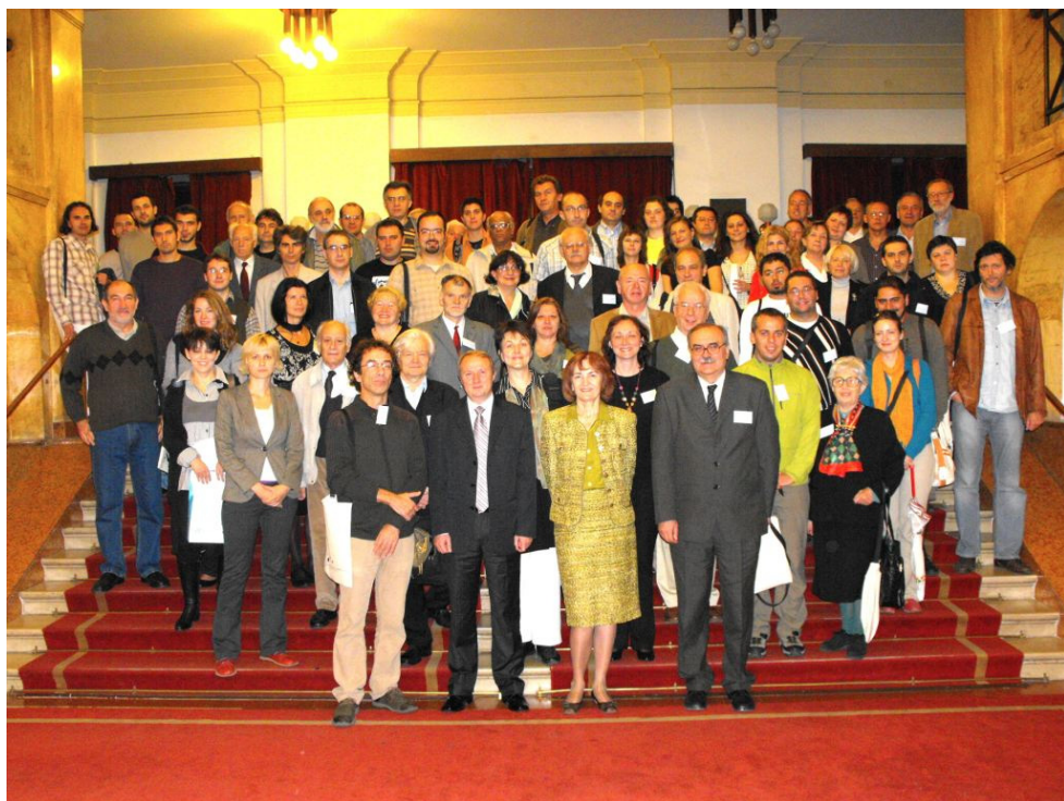
Слика 1: Учесници XV Националне конференције астронома Србије, 2-5 октобар 2008, Задужбина Илије М. Коларца, Београд, Србија.