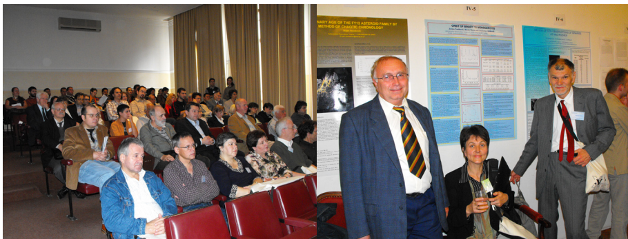
Слика 2: Детаљи са конференције. У сали где су одржавана предавања (лево) и за време постер секција (десно).