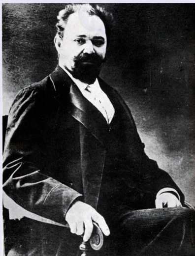
Đorđe Stanojević (1858-1921)