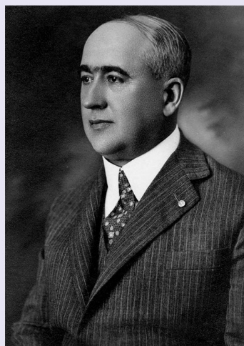
Milutin Milanković (1879-1958)