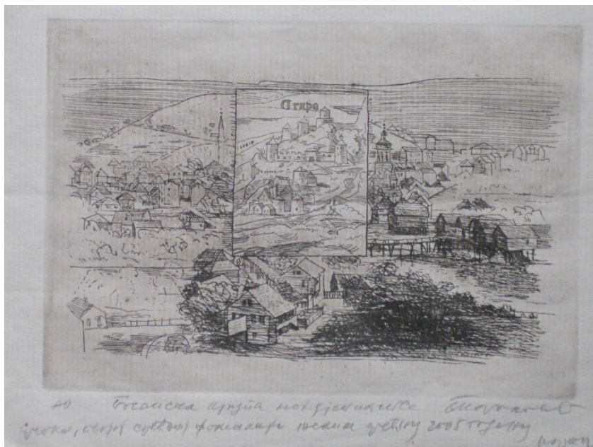
Слика 1: Босанска Крупа, бакропис.

Професорова уметност не трпи осредњост као ни компромис слабоумних сликара.