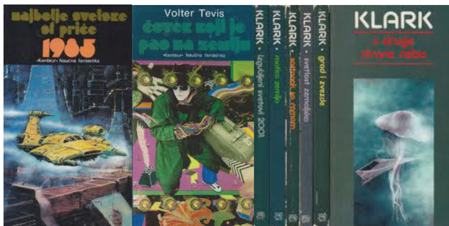
Слика 4. Едиција „Кентаур“.

Едиција “Kentaур” је покренута 1967. године и објављено је неколико књига. Свој нови почетак та едиција је имала 1976. године. Уз пробране наслове и изузетан квалитет за тадашње услове била је прави светионик научне фантастике у Југославији. Дела најпознатијих писаца су била објављена у тој едицији (Артур Кларк, Исак Асимов, Станислав Лем, Урсула ЛеГуин, Филип Дик, Френк Херберт итд.) и имала су сасвим солидан тираж. Едиција је покрила доста поджанрова научне фантастике – од утопије и антиутопије до тзв. “тврде” научне фантастике. Објављивала је и дела која су пратила дух времена – дела која су спадала у тзв. “нови талас” који је постао доминантан у научној фантастици у другој половини ’60-их и првој половини ’70-их година. Сваки љубитељ sf-а могао је у овој едицији да пронађе нешто за себе. Едиција је “потрајала” читаву деценију и поставила је неке одређене стандард квалитета објављених дела овог жанра на територији СФРЈ.