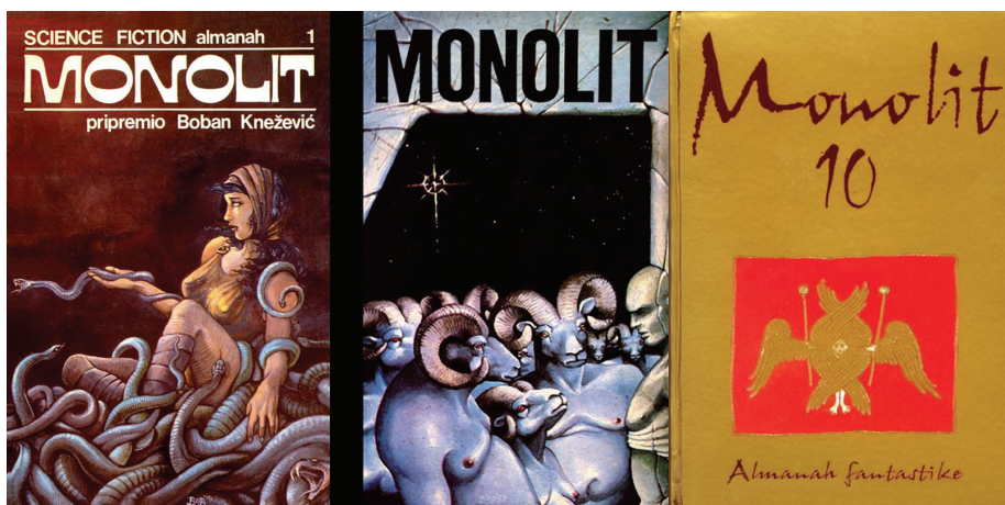
Слика 7. Алманах „Монолит“.