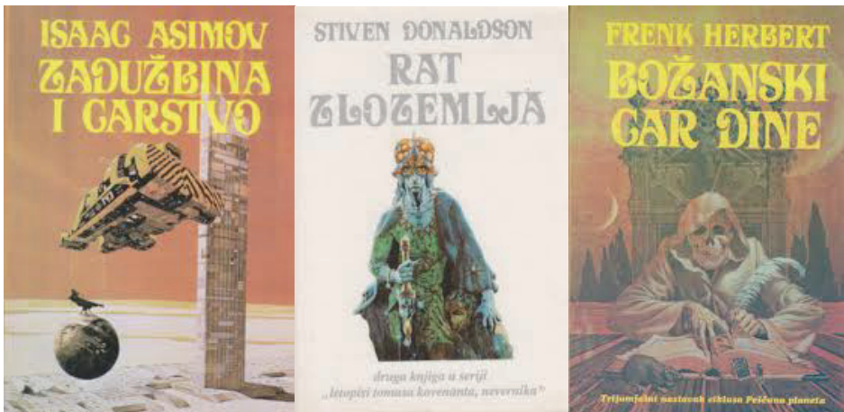
Слика 6. Едиција „Поларис“.