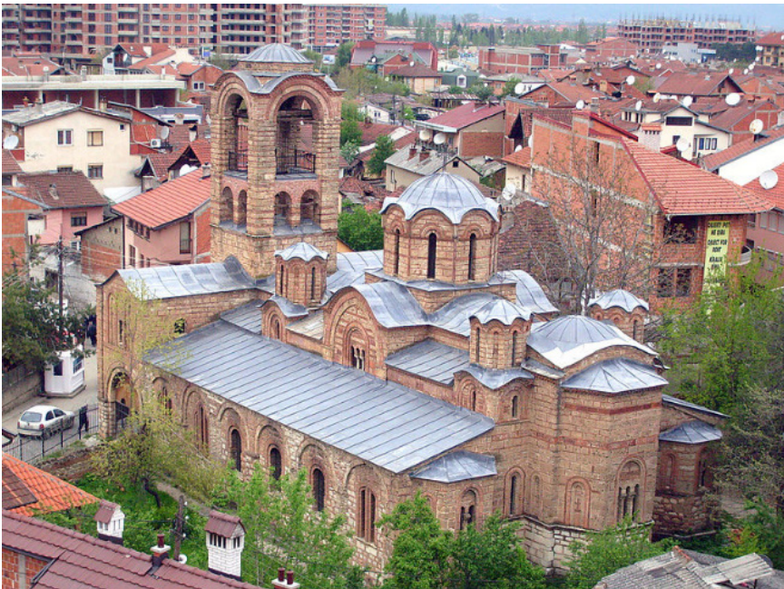
Слика 4: Богородица Љевишка.

Богородица Љевишка је петокуполна катедрала која се налази у старом делу Призрена. Црква је подигнута 1306 -1307. године на остацима старије из 11. столећа. Богомољу је из темеља обновио краљ Милутин уз помоћ епископа Дамјана и Саве. Посвећена је Успењу Пресвете Богородице. Непосредно након изградње, осликана је 1308–1314. године. Као главни живописци храма потписани су Михајло и Евтихије из породице Астрапа, док је у осликавању учествовало више мајстора (Панић, Бабић, 2007). Из богатог иконографског опуса, издвојили би представе Сунца и Месеца које се налазе у егзонартексу. Начин на који су осликане неодољиво подсећа на дечанске представе са фреске Христовог Распећа. Својим обликом, и исцртаним крацима на „капљичастом“ омотачу дочаравају кретање. Примећује се велика сличност са дечанским, којима фреске из Богородице Љевишке претходе.