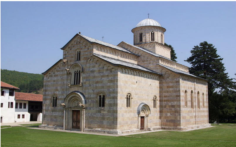
Слика 1: Манастир Високи Дечани.

Овде ћемо размотрити могућност да су „капљичасти“ омотачи са зрацима око представа Сунца и Месеца на фрескама у Богородици Љевишкој и Високом Дечанима настали под утицајем проласка Халејеве комете 1301. године.