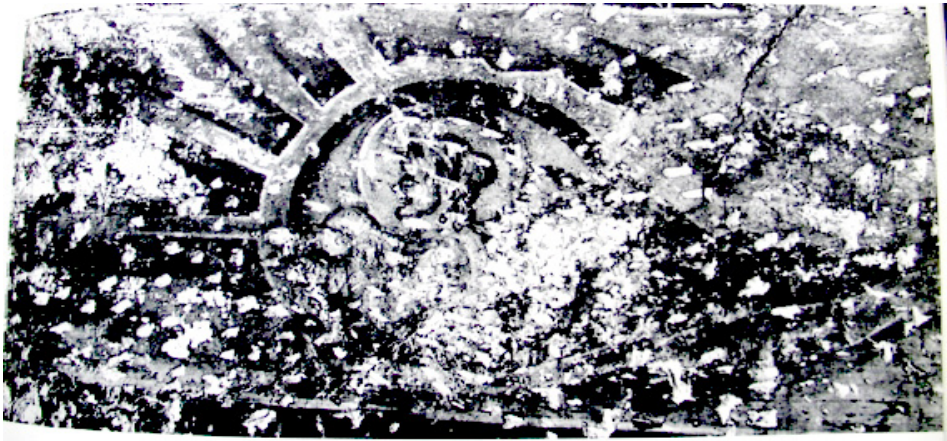
Слика 5: Представа Сунца у Богородици Љевишкој.

Фреске из цркве Богородице Љевишке у Призрену не представљају једину аналогију. Као сличне представе небеских тела Ђурић (Džurić, 1989) помиње и сцене из цркве Св. Климента у Охриду у којој се, на фресци Успења Пресвете Богородице, у „капљичастим“ небулама налазе апостоли које лебде изнад сцене. Иконописци Михајло и Евтихије су главни сликари као и цркве у Призрену. Као још једну аналогију Ђурић помиње и фреске Псалма 148 из манастира Лесново, подигнутог 1341. године.