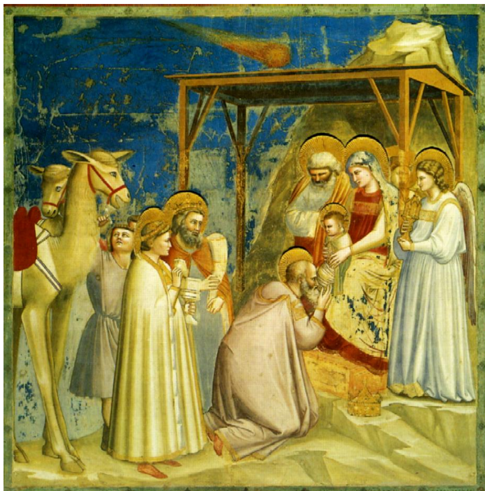
Слика 6: Ђотова фреска “Поклоњење мудраца” у капели Дељи Скровењи у Падови, на којој је Халејева комета која се видела 1301. године.

тела су представљена тако да су у покрету додавањем на постојећи „капљичасти“ омотач зракастих елемената који јако наглашавају кретање. Изгледа да је дечански уметник имао јак узор у фрескама призренске цркве. Питање које се намеће је шта је могла бити инспирација живописцима Богородице Љевишке?